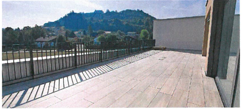
Von der Terrasse der Attika hat man einen schönen Blick auf den Stauffberg mit seiner Kirche. Hier lässt sich herrlich entspannen.

Generalunternehmer des «Tilia» ist die JKB Immobilien AG in Frick. Zuständig für Architektur und Projektleitung sind die Architekten der Bäumlin+John AG, ebenfalls in Frick beheimatet. «Wir verfolgen bei unseren Aufträgen immer bis ins Detail das optimale Zusammenspiel von städtebaulicher Präzision, architektonischer Ästhetik, optimaler Funktionalität und nachhaltiger Wirtschaftlichkeit», so die Architekten. Davon zeugt auch der neue Wohnpark Tilia.