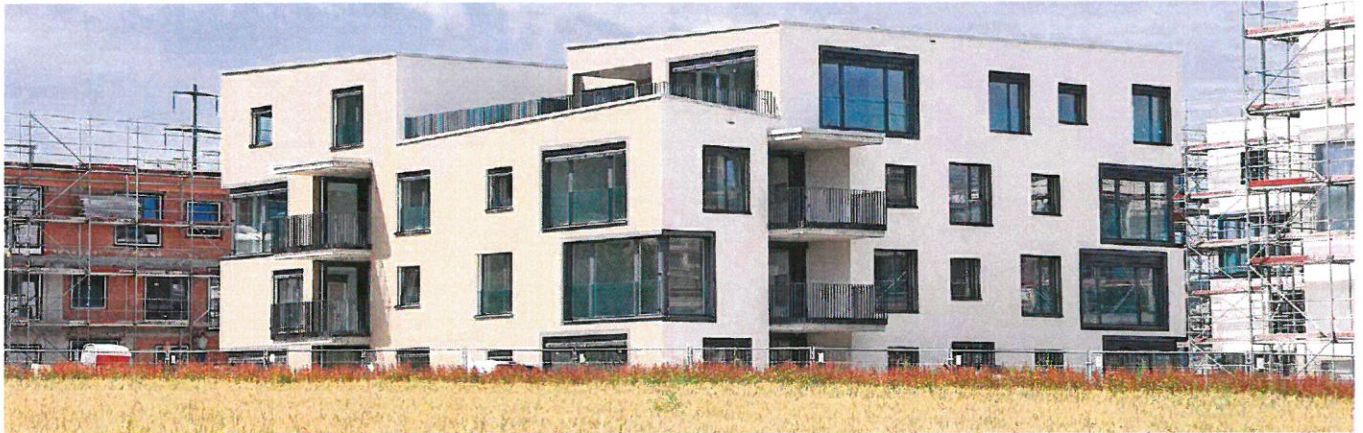
Zeitlose Architektur: Wohnpark Tilia mit total sieben Häusern. Die ersten Wohnungen sind bezogen. Wenige Eigentumswohnungen sind noch zu haben; Interessenten können jetzt noch beim Innenausbau mitbestimmen.

Der Wohnpark Tilia in Staufen am Dorfrand zu Schafisheim ist bald fertig gebaut