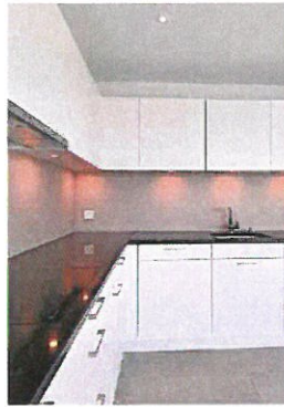
Stilvolle Küche mit Granitabdeckung.